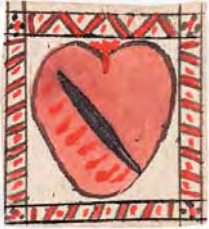
Herz Jesu, Andachtsblatt aus Kloster Weiler bei Esslingen (um 1500)

Ein umfangreiches Rahmenprogramm ergänzt das Ausstellungs- und Führungsangebot mit Vorträgen, Konzerten, Exkursionen sowie kulturellen Veranstaltungen für Kinder und Erwachsene an den historischen Orten. Das reich illustrierte und umfangreiche Begleitbuch dokumentiert den neuesten Forschungsstand zu diesem wichtigen Kapitel der Geschichte Esslingens und ist zugleich ein profundes Nachschlagewerk.