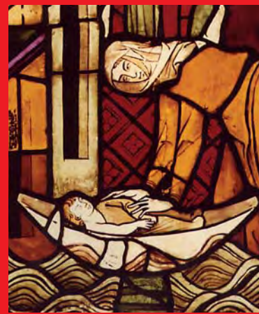
Auffindung des Moses, Glasfenster aus der Franziskanerkirche Esslingen (um 1325)

Diese wichtige Epoche in der Geschichte Esslingens wird in einer umfangreichen Ausstellung erstmals umfassend präsentiert.