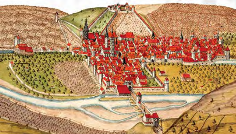
Ansicht Esslingens aus dem Kieserschen Forstlagerbuch (1685)

Die Ansiedlung der Bettelorden spiegelt die ungewöhnlich dynamische Entwicklung der Stadt im Mittelalter wider. Von diesem Wohlstand und dem Weinbau angezogen, richteten auch zahlreiche auswärtige Klöster und andere geistliche Institutionen Pfleghöfe als Wirtschaftsfilialen in der Stadt ein. Von hier aus verwalteten sie ihren Besitz und ihre Einkünfte in der Stadt und in der näheren Umgebung.