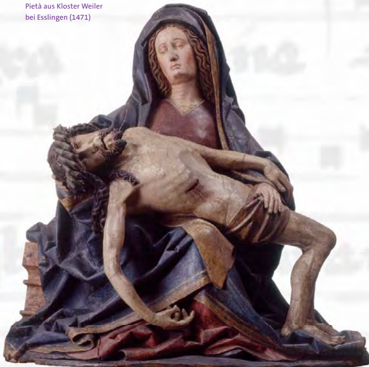
Pietà aus Kloster Weiler bei Esslingen (1471)

Zentraler Ausstellungsort Franziskanerkirche Esslingen Franziskanergasse 4/ Eingang Blarerplatz 73728 Esslingen am Neckar Telefon 0711/3512-3240