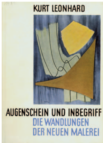
Kurt Leonhard, Cover zu ›Augenschein und Inbegriff. Die Wandlungen der Neuen Malerei‹, Deutsche Verlags-Anstalt, Stuttgart 1953