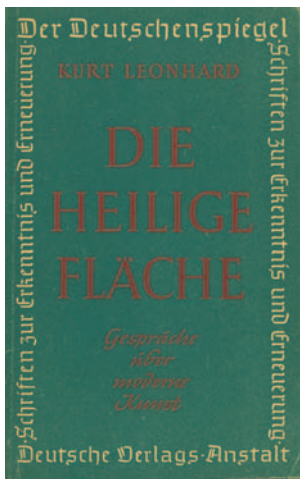
Kurt Leonhard, Cover zu ›Die heilige Fläche. Gespräche über moderne Kunst‹, Deutsche Verlags-Anstalt, Stuttgart 1947