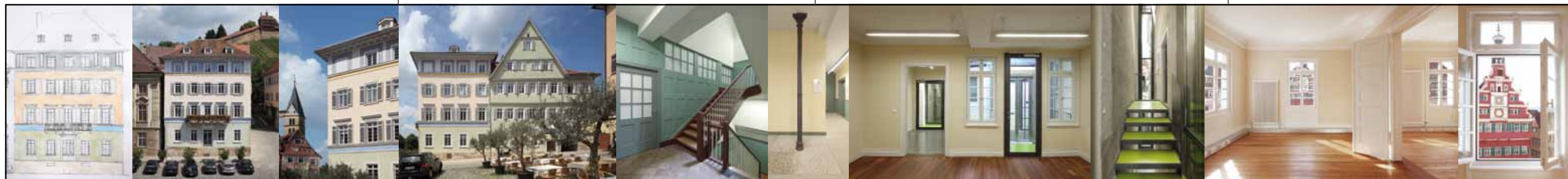
Ergebnis der Farbuntersuchung

Baubeschluss: 14.04.2008 Baubeginn: 22.06.2009 Einzug: März 2011