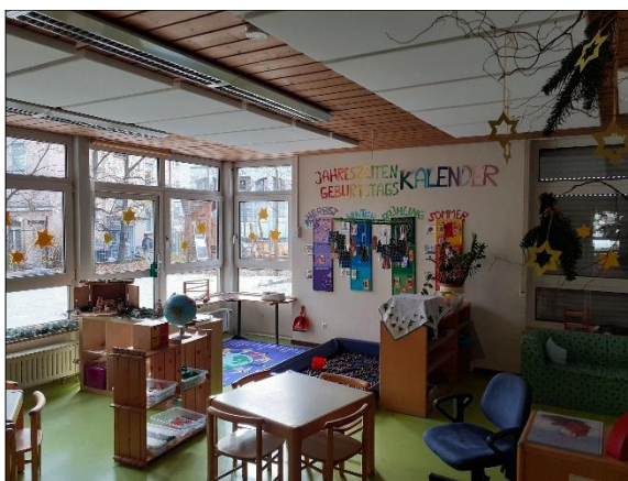
Abbildung 1: EG, Gelbe Gruppe