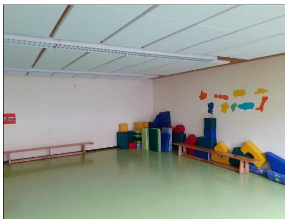
Abbildung 2: EG, Turnraum