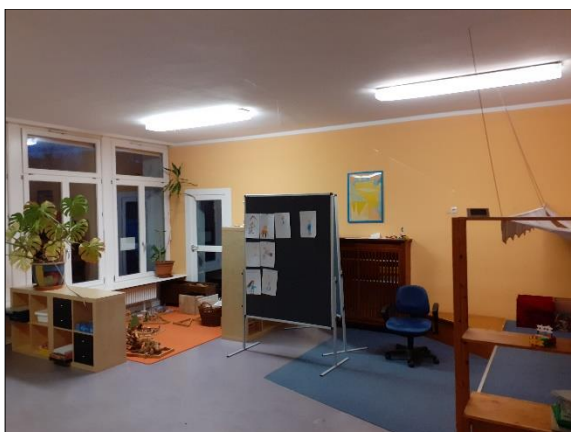
Abbildung 1: EG, Gruppenraum