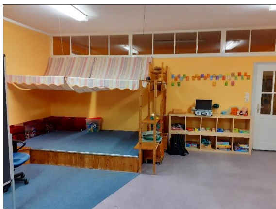
Abbildung 2: EG, Gruppenraum