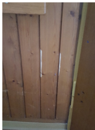
Abb. 12: (6) UG, Mehrzweckraum, Holzverkleidung