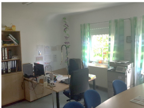
Abb. 7: (4) DG, Büro