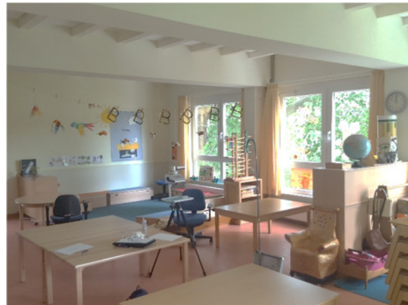
Abb. 4: (2) EG, Gruppenraum