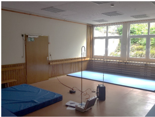
Abb. 1: (1) UG, Mehrzweckraum