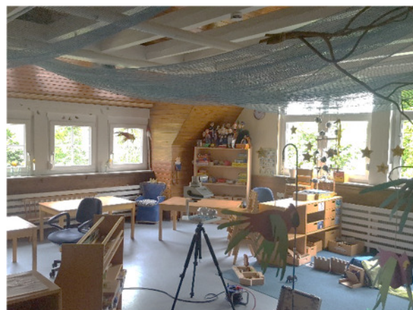
Abb. 6: (3) DG, Gruppenraum