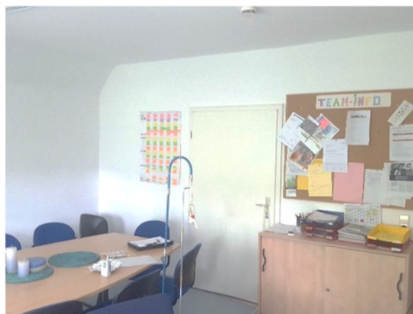
Abb. 8: (4) DG, Büro