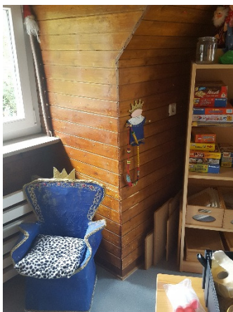
Abb. 9: (5) DG, Gruppenraum, Holzverkleidung