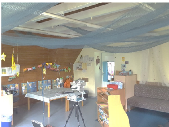
Abb. 5: (3) DG, Gruppenraum