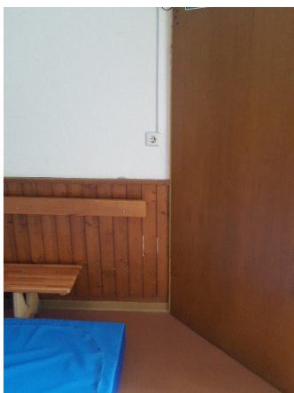
Abb. 11: (6) UG, Mehrzweckraum, Holzverkleidung