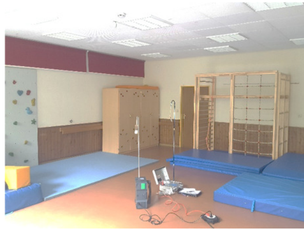
Abb. 2: (1) UG, Mehrzweckraum