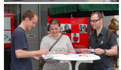
Impressionen von den Infoständen im Stadtgebiet