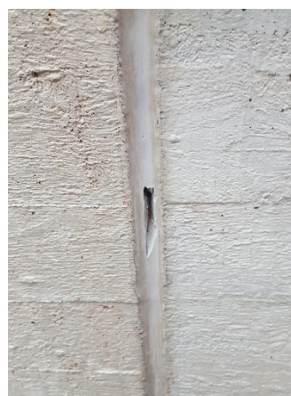
Abb. 10: (5) Außenfuge