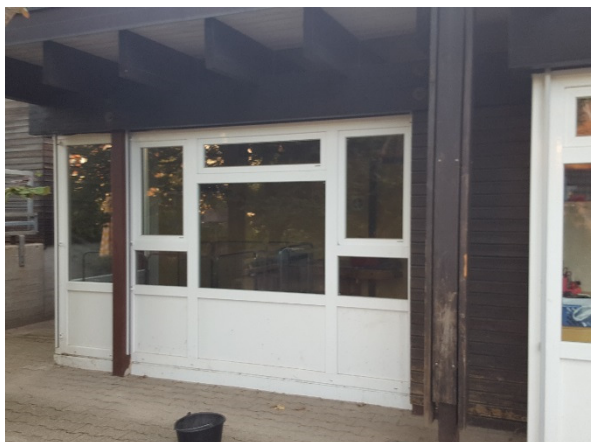
Abb. 7: (4) Außen, Holzbalken