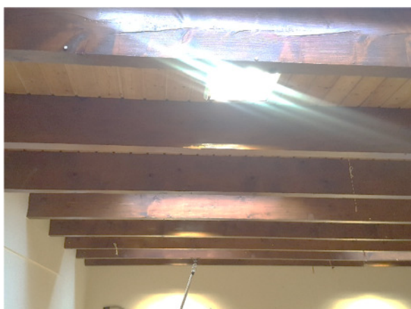
Abb. 5: (3) Mehrzweck-/Schlafraum, offene Holzbalken an Decke