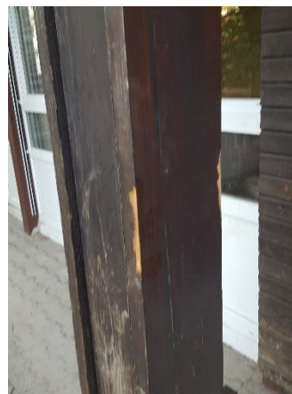
Abb. 8: (4) Außen, Holzbalken