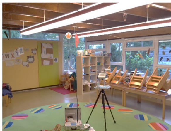
Abb. 4: (2) Gruppenraum Rotfüchse