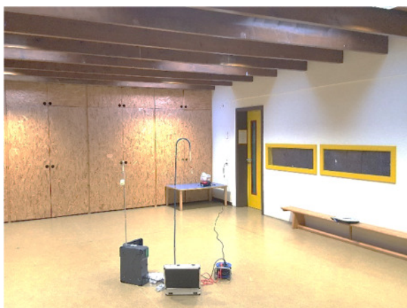
Abb. 1: (1) Mehrzweck-/Schlafraum