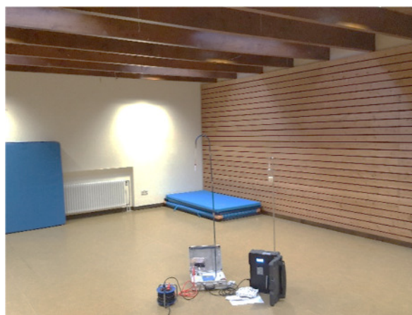
Abb. 2: (1) Mehrzweck-/Schlafraum