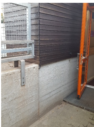
Abb. 9: (5) Außenfuge