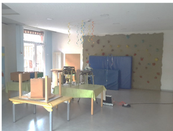
Abb. 1: (1) EG, Mehrzweckraum