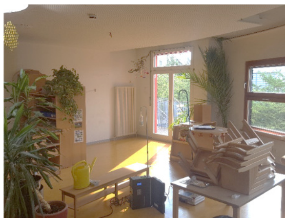
Abb. 4: (2) OG, Gruppe 3