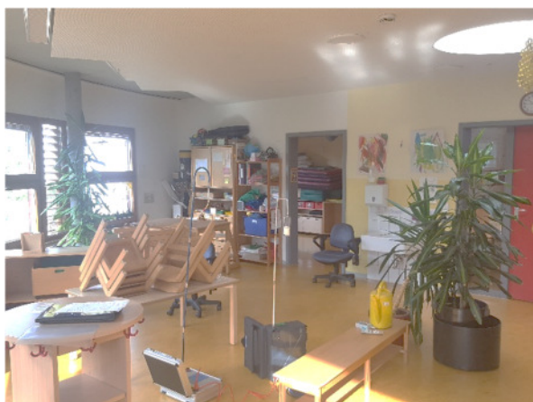
Abb. 3: (2) OG, Gruppe 3