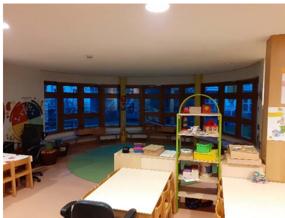
Abbildung 1: EG, Aufenthaltsraum