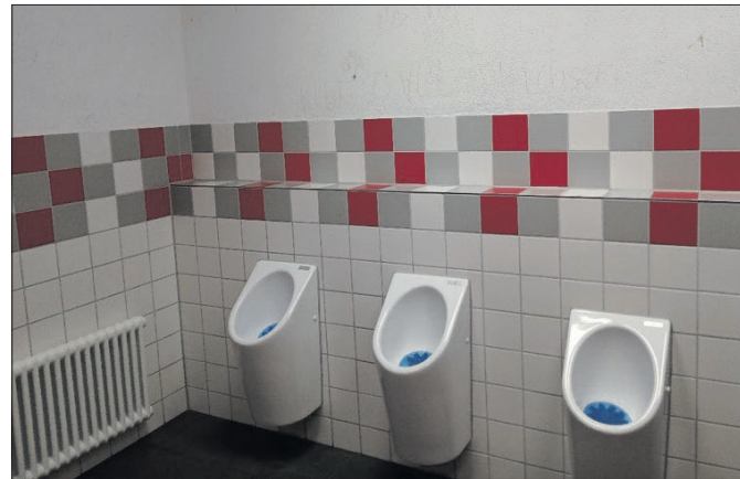
Die Toiletten im Mörike-Gymnasium sind bereits saniert.

Des Weiteren werden die WC-Anlagen der Lehrkräfte im Fachklassentrakt des Mörike-Gymna-