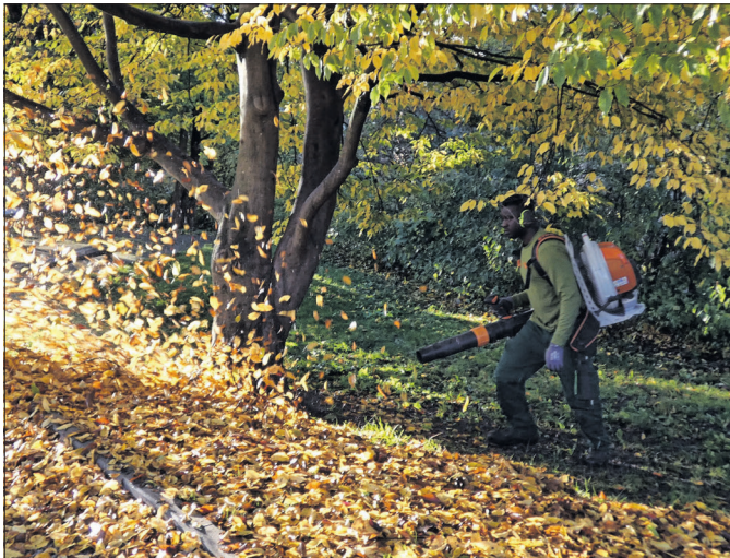
Die Pflege von Grünflächen soll im Rahmen der Konsolidierung reduziert werden; die große Kehrmachine soll ebenfalls eingespart werden.

Auch bei der Pflege der Grünanlagen und der öffentlichen Flächen sind Veränderungen geplant. „Unser Grundsatz wird hier lauten: