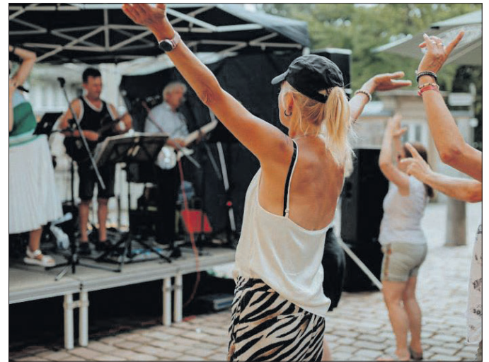
Es darf wieder getanzt werden: Die beiden Hauptbühnen des Schwörfests stehen dieses Jahr auf dem Rathausplatz und dem Hafenmarkt.