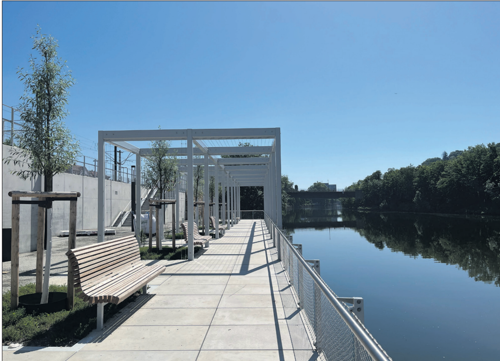
Die Terrasse des Neckarbalkons ragt über den Fluss und ist einer der vielen tollen neuen Aufenthaltsorte direkt am Neckar. Am Samstag, 20. Juni, wird die Grünanlage nach zweieinhalbjähriger Bauzeit offiziell eröffnet.

Um den verschiedenen Ansprüchen an die Flächen gerecht zu werden, wurden mit ganz unterschiedlichem Saatgut Pflanzen angesät. Neben klassischem Rasen kommt auch eine bunte, insektenfreundliche Wiesenmischung mit vielen Kräutern zum Einsatz. Da diese Kräuter etwas länger zum Keimen brauchen, kann das Grün im Moment noch lückenhaft wirken. Manche Stellen sehen deshalb vielleicht noch „unfertig“ aus und zeigen offene, braune Erde. Im westlichen Bereich des Parks in Richtung Rossneckar wurden zudem bewusst Flächen frei gelassen, auf denen alles wachsen darf, was von alleine kommt (sogenannte Sukzessionsflächen).