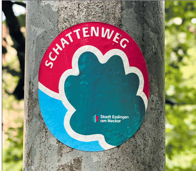
Mit diesen Stickern ist der Schattenweg in Esslingen gekennzeichnet, der mittlerweile zweieinhalb Kilometer lang ist und quer durch die Innenstadt führt.