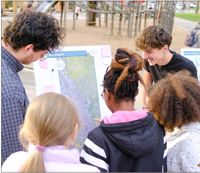
Zu den für unterschiedliche Zielgruppen angelegten Veranstaltungen kamen jeweils mehr Menschen als erwartet – und sie hatten viele gute Ideen dabei.

Obwohl das Quartierszentrum offiziell erst im Sommer eröffnet wird und noch einzelne Renovierungsarbeiten laufen, sind einige Angebote bereits gestartet. So ist das