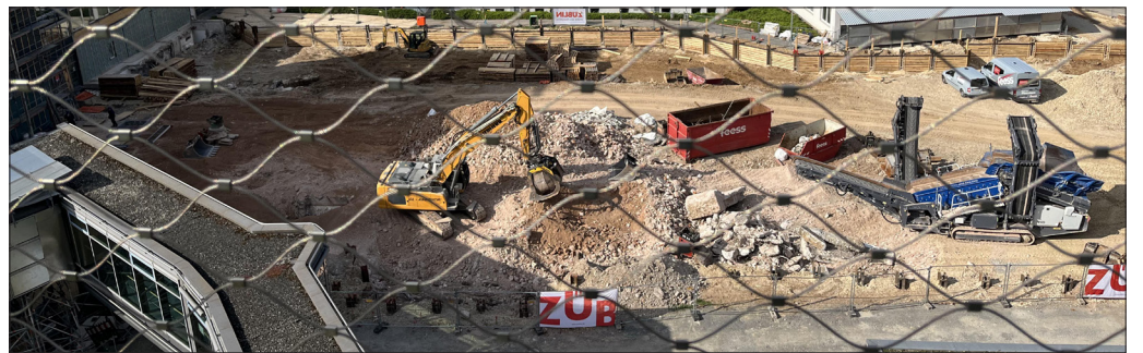
Der Baufortschritt aus der Vogelperspektive zeigt den Aushub der Baugrube für das künftige Haus 2.

Inbetriebnahme 2029 geplant Bereits im Jahr 2024 hatte der Esslinger Gemeinderat dem „Masterplan Bau“ zugestimmt und damit den Weg für die Modernisierung des Klinikums Esslingen geebnet. Insgesamt sollen rund 200 Millionen Euro in die Zukunft des Klinikums investiert werden. Der aktuelle Bauabschnitt umfasst den Abriss und Neubau von Haus 2, einem zentralen Gebäude auf dem Klinikcampus, sowie die Errichtung einer vollständig neuen Be-