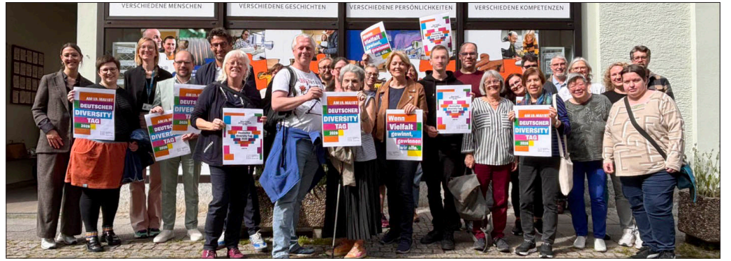
Beim Diversity-Tag im ZAK wurde deutlich, wie vielfältig die Esslinger Stadtgesellschaft ist.