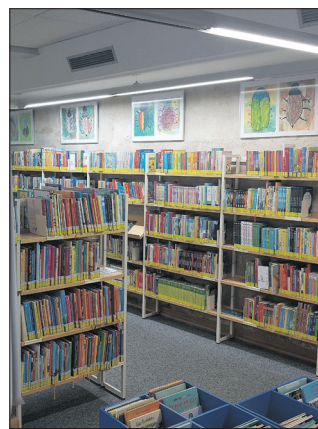
Die Sanierung der Stadtbibliothek wird fortgeführt.

steine. Diese Maßnahmen sehen neben der Beseitigung von bestehenden Mängeln am Gebäude und an den technischen Anlagen auch eine deutliche Aufwertung der Raum- und Aufenthaltsqualität vor. Die Städtischen Gebäude Esslingen (SGE) rechnen mit Kosten von 18,9 Millionen Euro. Darüber hinaus hat der Gemeinderat dafür gestimmt, dass die Stadtverwaltung die Festlegung von Teilen der Altstadt als Sanierungsgebiet vorbereitet und sich um die Aufnahme in ein Städtebauförderprogramm bemüht. Hierzu steht die Stadt Esslingen im Austausch mit dem Ministerium für Landesentwicklung und Wohnen. Die Ent-