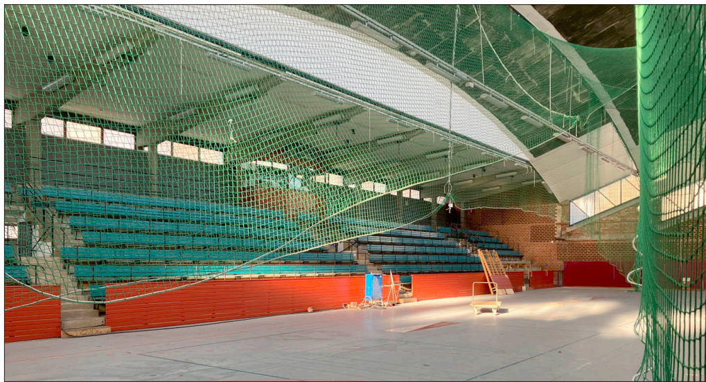
Die Sanierung der Schelztorsporthalle soll im Rahmen der Sparmaßnahmen verschoben werden.

Im Sport sollen rund 604.000 Euro eingespart werden. Dafür werden unter anderem die Sanierungen der Schelztorsporthalle und der Turnhalle der Pliensauschule verschoben. Zusätzlich soll der Landkreis höhere Gebühren für die Nutzung der Sporthalle Zell zahlen, Reinigungsleistungen werden reduziert und der Schließdienst in der Sporthalle Weil eingestellt. Außerdem wird die Sportförderung nicht erhöht.