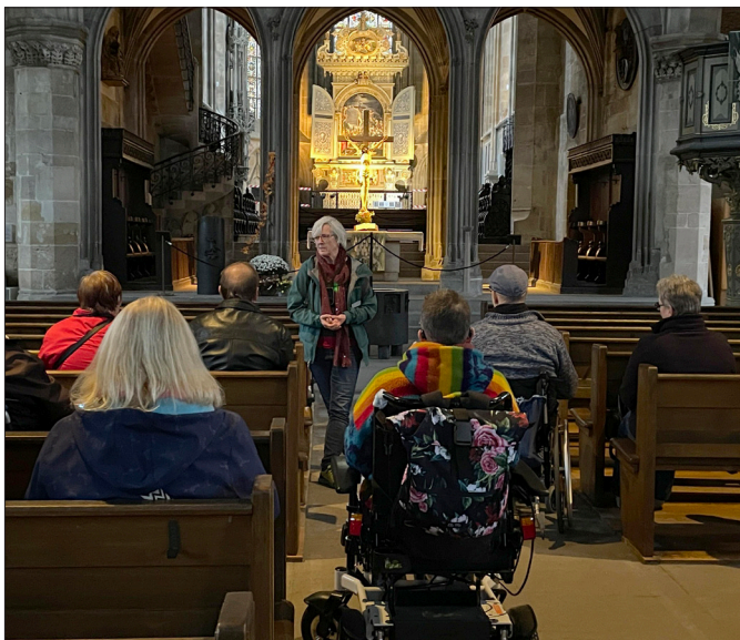
Die Tour führt auch in die Stadtkirche St. Dionys.