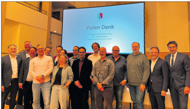
Der neu gewählte Bürgerausschuss Innenstadt.

Die Verwaltung möchte aber prüfen, inwieweit eine Interimsunterbringung der Stadtbibliothek während der Bauzeit möglich ist. Zudem soll eine Bewerbung für die Aufnahme von Teilen der Altstadt in ein Stadtbauförderpro-