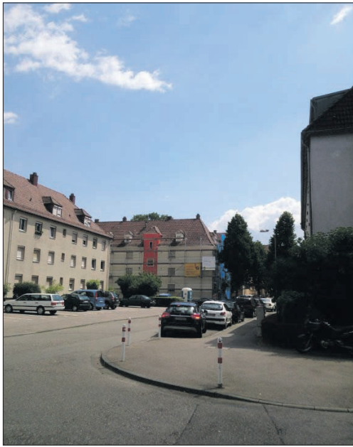
Der Vorher-Nachher-Vergleich aus dem Stadtteil Weil zeigt deutlich, wie neu gepflanzte Bäume wirken.

Die meisten Standorte befinden sich in Wohnstraßen, in denen die neu gepflanzten Bäume in bisher schattenlosen und von Hitze geplagten Bereichen für Kühlung sorgen werden. Für die Baumstandorte werden Sperrflächen, Verkehrsinseln und bestehende Beete genutzt. „Es werden auch einzelne Parkplätze wegfallen“, sagt Florian Pietsch, der das Projekt im Grünflächenamt leitet. Alle Standorte, die nun umgesetzt werden, wurden im Vorfeld umfassend geprüft – dabei waren Tiefbau- und Ordnungsamt, Feuerwehr, Denkmalschutz sowie die Leitungsträger beteiligt. In den vergangenen Wochen hat die Stadtverwaltung die dieses Jahr anstehenden Tiefbaumaßnahmen, alle Pflanzarbeiten so-