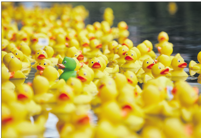
Welche Ente schwimmt am schnellsten durchs Ziel?

Das Wochenende ist vollgepackt mit einem bunten Rahmenprogramm, das vielseitige Erlebnisse für die ganze Familie bietet: Am Samstag und Sonntag, 25. und 26. April , jeweils von 11 bis 17 Uhr, finden die beliebten Gartentage in der Ritterstraße und rund um den Rathausplatz statt – dieses Mal wird das 25-jährige Jubiläum gefeiert. Aufgrund des Marktplatzumbaus waren die Planungen dieses Jahr etwas herausfordernder, doch gemeinsam haben die Akteurinnen und Akteure gute Lösungen gefunden: „Für die Gartentage kann dieses Mal der Ehrenhof des Amtsgerichts mitgenutzt werden“, sagt Carina Killer, Citymanagerin der EST. Parallel zu den Gartentagen lädt ein Büchermarkt zum Stöbern ein. Am Samstag, 25. April, ergänzt der Esslinger Wochenmarkt von 7 bis 12:30 Uhr in der