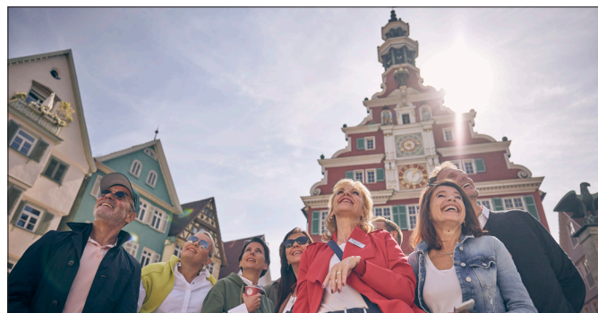
Zu den Angeboten gehören auch die Stadtführungen durch Esslingen.

Zu den städtischen Angeboten zählen beispielsweise die Villa Merkel, die Städtischen Museen, das Kommunale Kino KoKi, die Württembergische Landesbühne WLB, Stadtführungen des Esslinger Stadtmarketings oder das Merkel'sche Bad. Auch das Kulturzentrum Dieselstrasse oder der Tierpark Nymphaea sind bereits dabei. Die Ehrenamtskarte