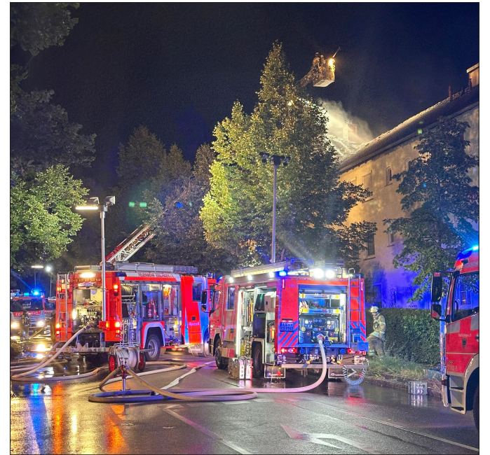
Bei einem Dachstuhlbrand in Oberesslingen war die hauptberufliche Abteilung gemeinsam mit mehreren freiwilligen Abteilungen im Einsatz.

Typisch für das Jahr 2025 war, dass der Aufwand für die Wartung von Fahrzeugen, Geräten und Gebäuden stark gestiegen ist. Grund dafür waren Schwächen in Unternehmen und Betrieben, weshalb man wieder häufiger improvisieren und vieles selbst erledigen musste. Die Leistungsfähigkeit der Feuerwehr in Einsätzen ist dabei ungebrochen, auch der anhaltende Generationswechsel bei den Feuerwehrangehörigen hat daran nichts geändert, das ist toll! Die Mitgliederzahlen sind weiterhin stabil. Aber auch das ist wichtig: Das Jubiläum 150 Jahre Abteilung Hegensberg-Liebersbronn mit vier Veranstaltungen über das Jahr verteilt war ein großer Erfolg. cop