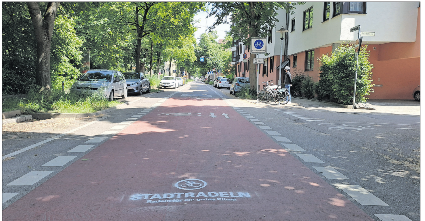
Zwischen der Esslinger Altstadt und Oberesslingen ist die Hindenburgstraße als Fahrradstraße ausgewiesen – hier haben Radfahrende Vorrang.

In Teilen von Oberesslingen, rund um die Breslauer Straße und ihre Nebenstraßen, ist eine Fahrradzone ausgewiesen. Diese erkennt man an den blauen Verkehrschildern mit einem Fahrradsymbol und dem Schriftzug „Fahrradzone“, auch auf der Straße selbst ist diese Markierung aufgebracht. In der Fahrradzone beträgt die Höchstgeschwindigkeit 30 km/h. Hier dürfen Radfahrende nebeneinander fahren. Andere Verkehrsteilnehmende müssen sich dem Tempo und dem Vorrang von Radlerinnen und Radlern anpassen. Auch das Rechts-vor-links-Prinzip gilt hier für alle gleich.