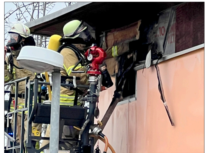
Der Brand in einer Kita am Zollberg ging glimpflich aus: Das Gebäude war zu diesem Zeitpunkt glücklicherweise leer.