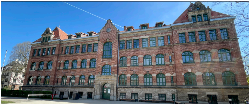
Das denkmalgeschützte Gebäude der Gemeinschaftsschule Innenstadt wurde 2024 saniert.

Im Schuljahr 2025/26 besuchen 8.515 Schülerinnen und Schüler in 333 Klassen die städtischen