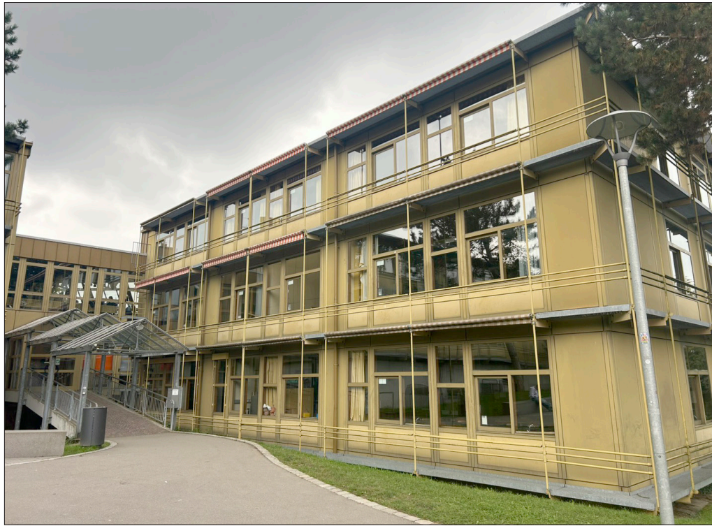
Am Schelztor-Gymnasium herrscht Platzmangel, ein Interimsbau soll jetzt Abhilfe schaffen.

Ein Interimsbau in Modulbauweise soll nun Abhilfe schaffen. Geplant sind insgesamt neun neue Klassenzimmer: sechs für das Schelztor-Gymnasium und drei für die Seewiesenschule. Ergänzt wird das Raumangebot durch eine Teamstation, einen Aufenthaltsbereich sowie Sanitär- und Technikräume. Die neuen Räume sollen bereits zum Schuljahr 2026/2027 zur Verfügung stehen.