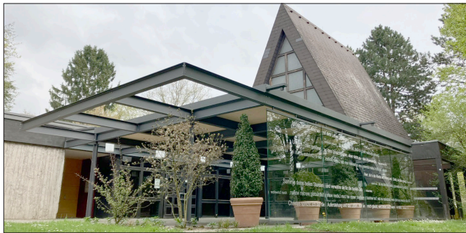
Die sanierte Trauerhalle in Hegensberg kann am Sonntag, 19. April, besichtigt werden.