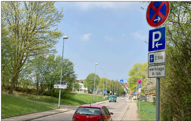
Die Halteverbote haben sich bewährt und bleiben bestehen.

Zwischen Sulzgries und Rüdern gilt nun durchgehend Tempo 30. Das Parken auf Höhe der Kirche/des Friedhofs ist wie bereits durch die Verwaltung umgesetzt nur zeitlich begrenzt möglich. Bestehen bleiben die Halteverbote sowie die vergrößerten Ausweichflächen für den Busverkehr. Diese Maßnahmen verbessern die