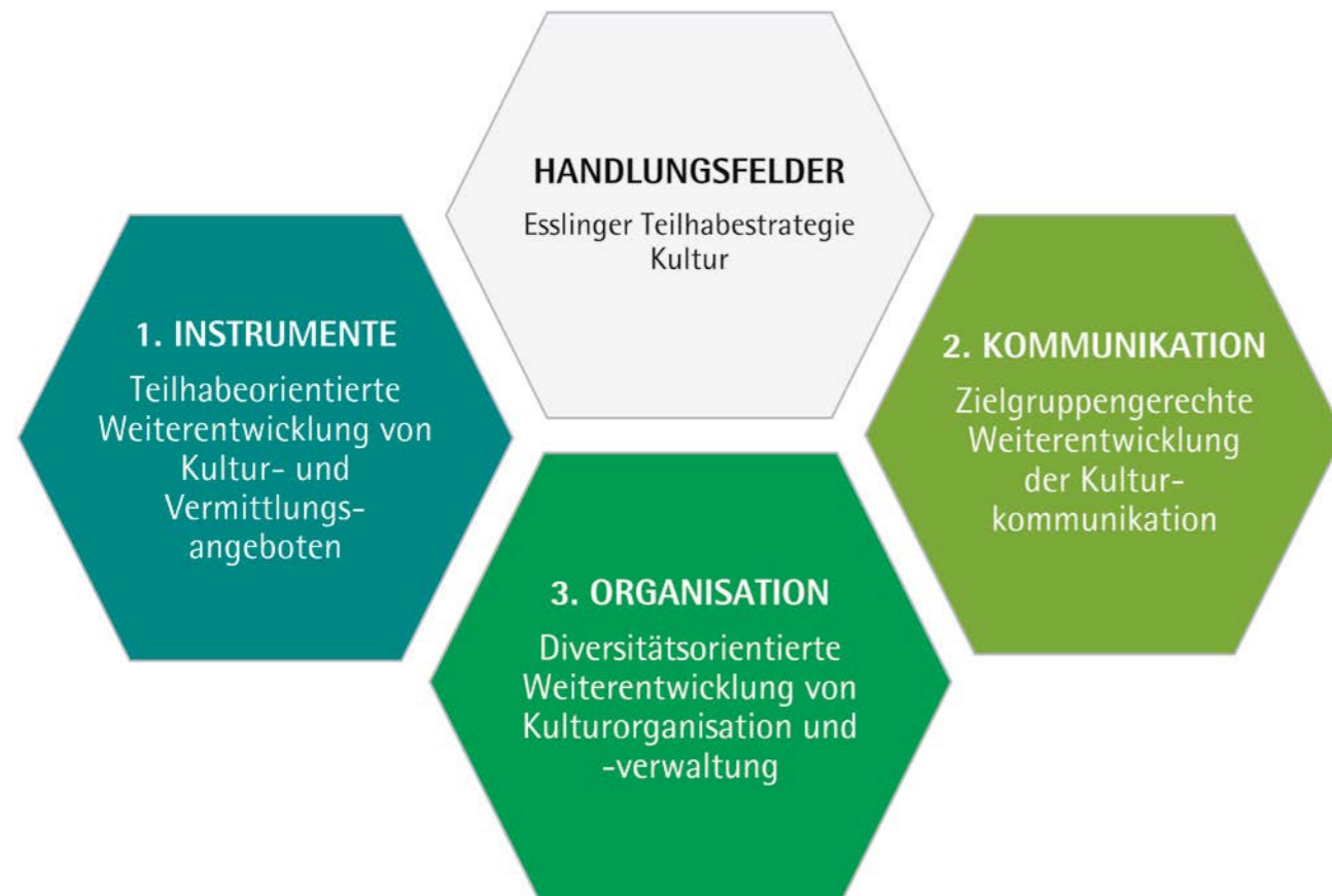
Abbildung 4: Handlungsfelder der Esslinger Teilhabestrategie Kultur (ETK)

Um auf die ermittelten Herausforderungen zu reagieren, wurden Ziele formuliert und Wege zu einer gemeinsamen Perspektive für die Stärkung Kultureller Bildung und Teilhabe in Esslingen entwickelt. Dies wurde unter anderem mithilfe der durchgeführten Analysen und des Beteiligungsverfahrens, insbesondere der Fokusgruppengespräche und der vier umfänglichen Themenworkshops verfolgt. Im Entwicklungsprozess der Esslinger Teilhabestrategie Kultur konnten schlussendlich drei Handlungsfelder abgeleitet und verdichtet werden, die Lösungsvorschläge für die im Prozess identifizierten Herausforderungen enthalten und die entwickelten Ziele und Maßnahmen bündeln sowie abschließend priorisieren (vgl. Abb. 4).