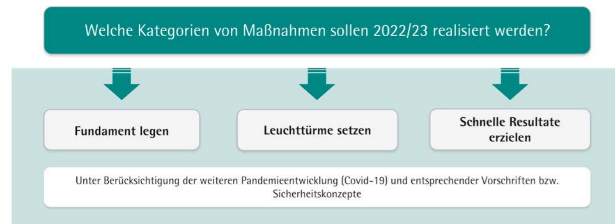
Abbildung 5: Priorisierungskategorien in der Übersicht

Auf dieser Grundlage wurde folgendes prioritäres Maßnahmenpaket (»Starter-Kit«) für den Umsetzungszeitraum 2022/23 definiert: