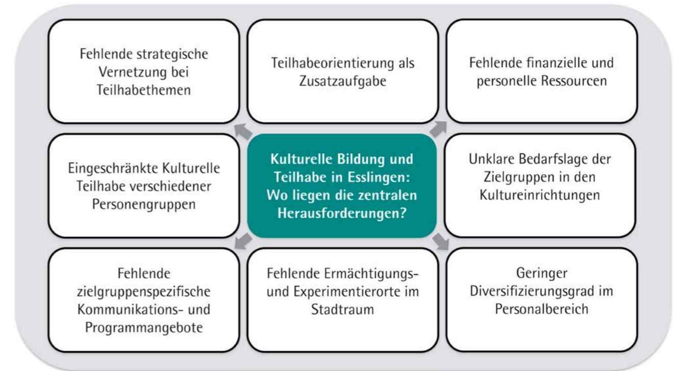
Abbildung 3: Herausforderungen der Kulturellen Bildung und Teilhabe der Stadt Esslingen in der Übersicht

Auch im städtischen Verwaltungsalltag wird aktuell der Tatsache, dass Kulturelle Bildung und Teilhabe eine Gemeinschaftsaufgabe mit zahlreichen bereichsübergreifenden Schnittmengen ist, z. B. zu Integration / Migration, Familie und Soziales, Bildung, noch zu wenig Rechnung getragen. Die verschiedenen städtischen Ämter sind hinsichtlich des Themas Kultureller Teilhabe bisher noch sehr eingeschränkt miteinander vernetzt. Hier wie dort fehlt es also an strategischen Zusammenschlüssen und Austauschformaten, damit es gelingen kann, das Esslinger Kulturangebot teilhabeorientiert weiterzuentwickeln und einen nachhaltigen Beziehungsaufbau zu den einzelnen Zielgruppen zu ermöglichen.