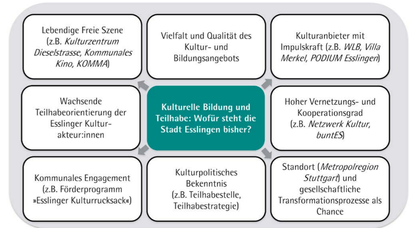
Abbildung 2: Stärken und Potenziale Kultureller Bildung und Teilhabe in der Stadt Esslingen in der Übersicht

Neben der geografischen Lage Esslingens als Teil der dichtbesiedelten und wachstumsstarken Metropolregion Stuttgart sind die Stadtgröße sowie die vielfältige, lebendige und engagierte Kulturszene als begünstigende Rahmenbedingungen für die Implementierung einer Teilhabestrategie Kultur zu nennen. Als große Mittelstadt mit 95.000 Einwohner:innen ist Esslingen klein genug, um mit übergreifenden Ansätzen einen großen Teil der Menschen in Esslingen zu erreichen. Gleichzeitig ist die Stadt groß genug, um aufgrund der Nachfrage eine große Vielfalt kultureller Angebote vorzuhalten. Mit Menschen aus 140 unterschiedlichen Nationen ist das städtische Leben Esslingens zudem durch eine besondere kulturelle Diversität gekennzeichnet und repräsentiert damit die Situation vieler (westdeutscher) Kommunen »unterm Brennglas«. In diesem Sinne kann die Umsetzung der Esslinger Teilhabestrategie Kultur auch als »Zukunftswerkstatt und Teilhabelabor« für andere Kommunen fungieren.